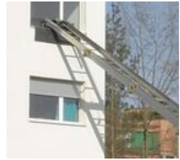
Fenstersims ? starkes Sims