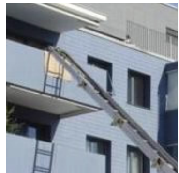
Balkonbrüstung aus Beton