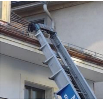
Dachkante mit Ziegel ? direkt auf Regenrinne