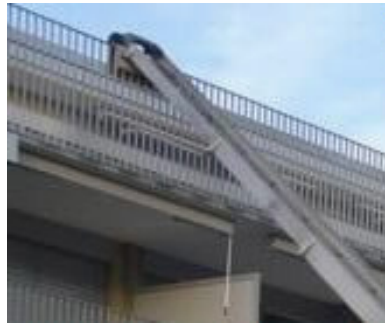
Balkongeländer ? starkes Geländer