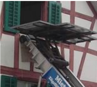
Hausmauer ? ist sie isoliert