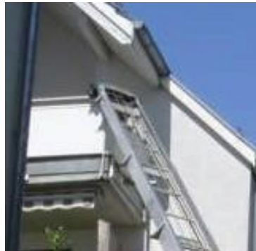
Balkonecke ? starkes Geländer