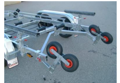
Slipvorrichtung mit 4 Räder