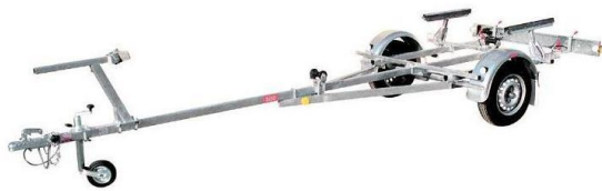
PBA 500 U