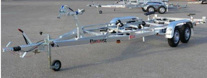
PBA 2600 T