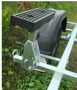
Gummiauflage PBA 500