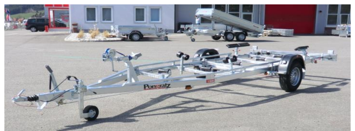
PBA 1500G Doppelrahmen