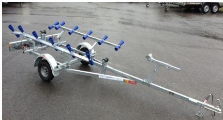
Schlauchbootanhänger PBA 500 U-S