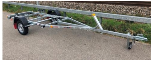
PBA 750 U