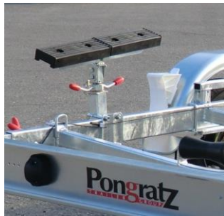
Gummiauflage 60cm mit Spindel