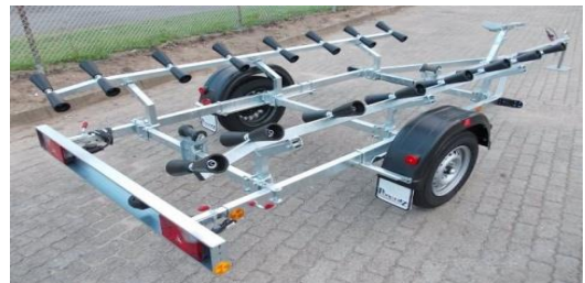
PBA 750 U-S