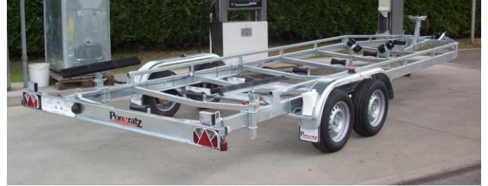
PBA 3500 T