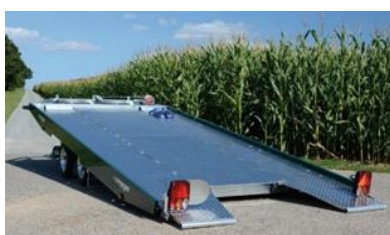
Typ KHL Boden geschlossen mit Aluriffelblech