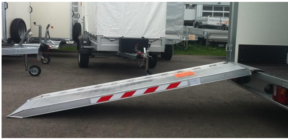
MPC mit Schutzrand