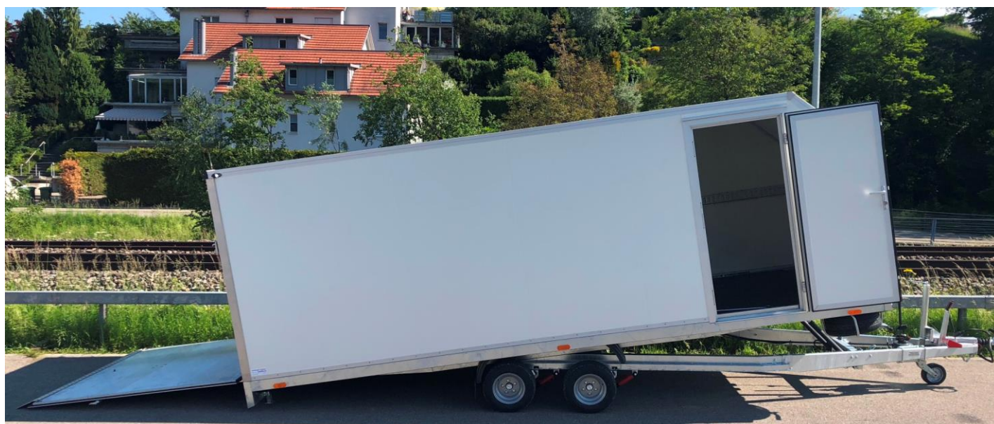
Formula 30.55 550 x 212 x 180cm, Seitentüre (Mehrpreis)