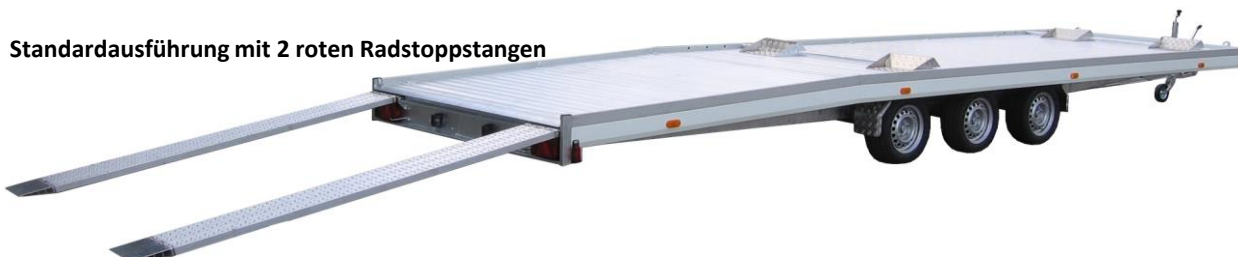
Standardausführung mit 2 roten Radstoppstangen