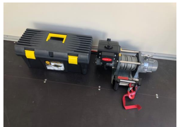
Elektro-Seilwinde am Boden montiert

November 2023 Im Nägelibaum 10, 8352 Rätterschen