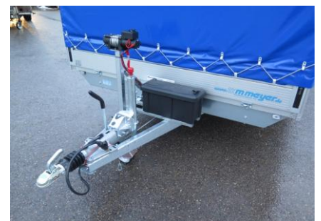
Elektro-Seilwinde auf Bock montiert