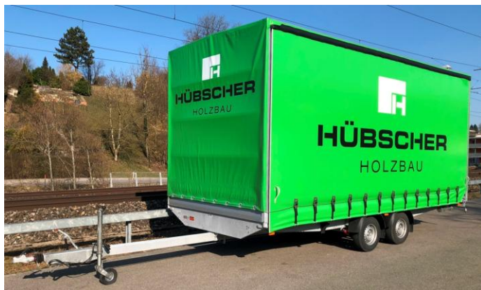
Schiebeblache mit Gurtverschlüsse, verlängerter Deichsel, Werbedruck