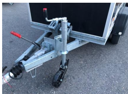
Stützrad 900kg mit Flanschplatte