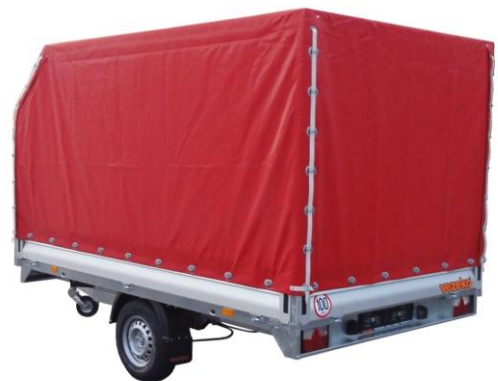
Blachenaufbau mit schräger Front