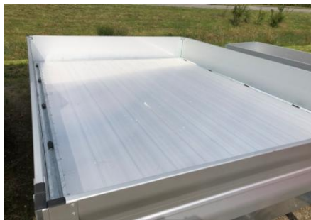
Aluminiumprofilboden statt Holzboden