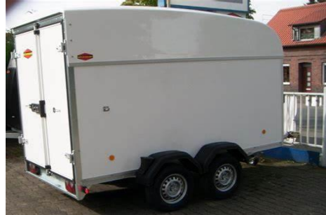
KT-P 3015/27 M