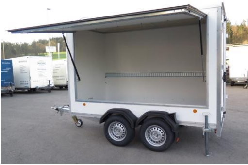
KT 3015/H Seitenklappe