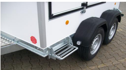
Klaptritt gross, seitlich