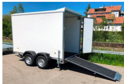
KT RT Plywoodwände, Polyesterdach eine Hälfte Türe, andere Hälfte Rampe