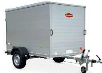
KT-AL Aluminiumwände, Polyesterdach Flügeltüre