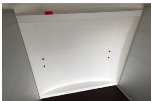
Ablagefach in Bugwand