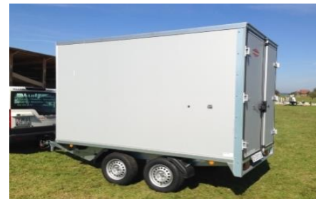
KH Hochlader Plywoodwände, Alu- oder Sandwichdach