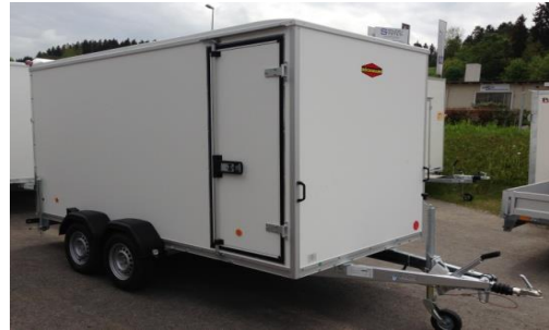
KT 4018/H Seitentüre