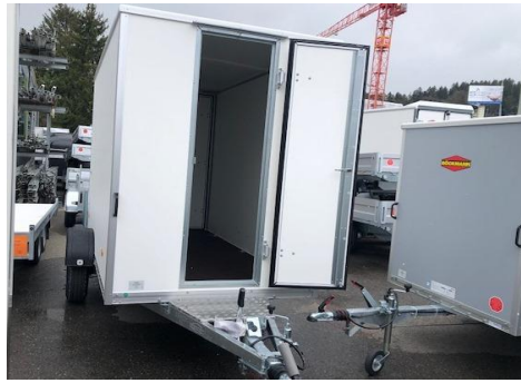
KT 3015 Türe in Stirnwand