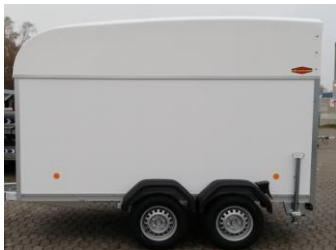
KT-P Plywoodwände hohes Polyesterdach Flügeltüren