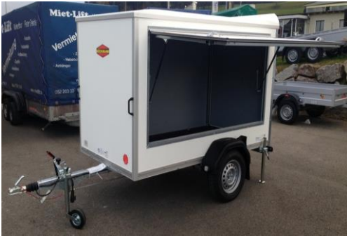
KT 2513 Seitenklappe