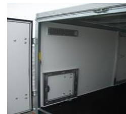
Lüftungsschieber, Service Tür