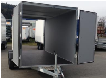
Fronttüren für das Durchladen zum Fahrzeug