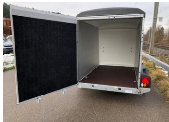
KT Kombirampe Plywoodwände, Polyesterdach Kombirampe, Rampe auch als Türe zu öffnen