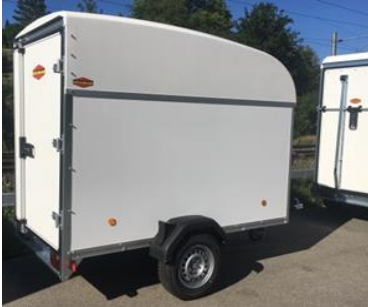
KT-P 2513/135 M

Wände nur mit Folien 3M 3690B oder Orajet 3951 HT beklebbar