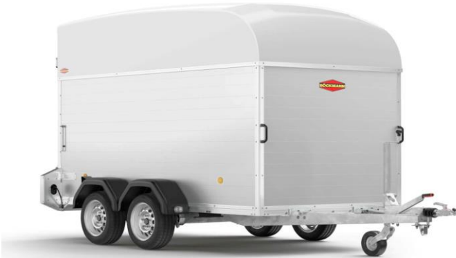
KT-P-AL 3015/27 M