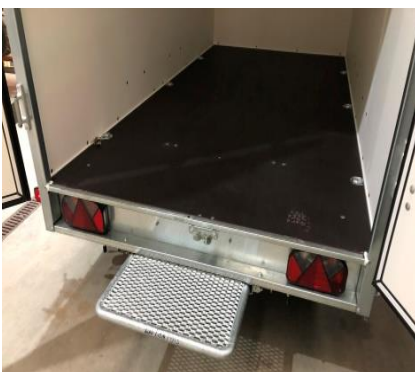
Auszugtritt Ausziehtritt Gitter ca. 60 x 30cm