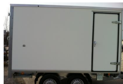
Klaptritt klein an Seitentüre