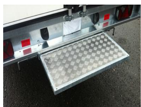
Auszugtritt mit Riffelblech