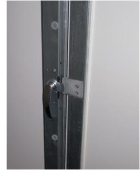
Türverschluss von innen zu öffnen (gegen Mehrpreis)