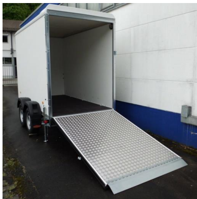
KT 3015/H Rampe mit Aluriffelblech