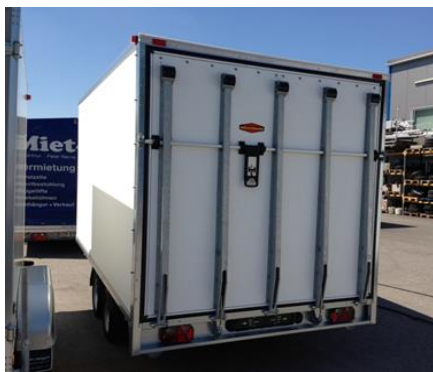
Hochlader mit Heckrampe, Hebehilfen