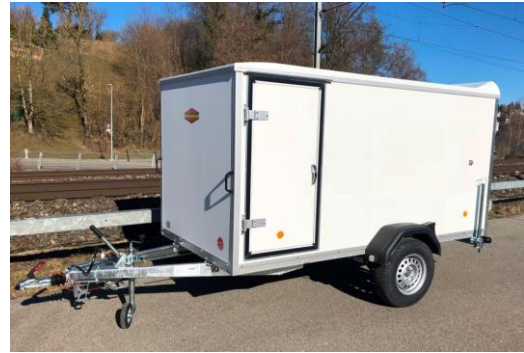
KT 3015 Seitentüre