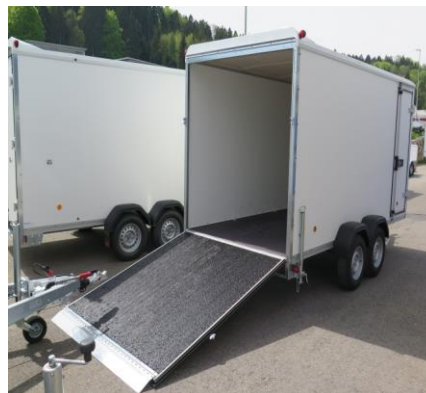
KT 4018/H Rampe mit Silikonbeschichtung