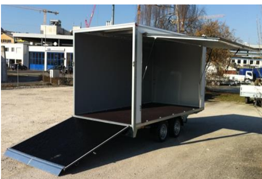
Rutschfester Silikonbelag, Anfahrblech, Seitenklappe