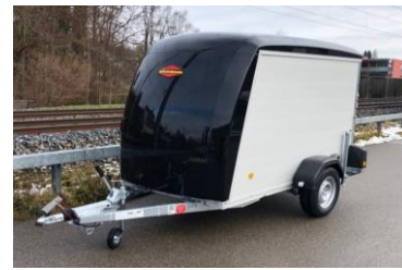
KT-PB-AL Aluminiumwände, Polyesterbug + Polyesterdach, Kombirampe (Rampe auch als Türe zu öffnen)