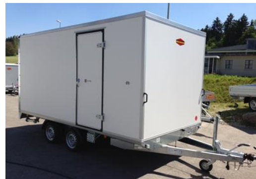
Hochlader mit Seitentüre und Klapptritt