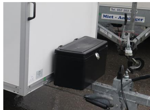
Werkzeugkisten diverse Grössen / Kunststoff und Aluminium