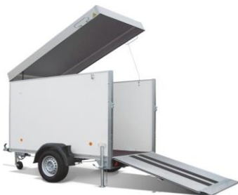
KT-2513/135K Plywoodwände, Aludach hochklappbar, Rampe mit Antirutschbelag