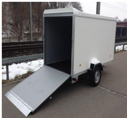
KT 3015 mit Rampe ohne Beschichtung