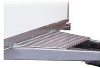
V-Deichsel mit Auftritt