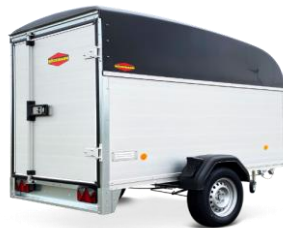
KT-P-AL Aluminiumwände hohes Polyesterdach Flügeltüre