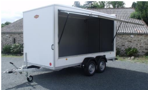
KT 4018/H Seitenklappe