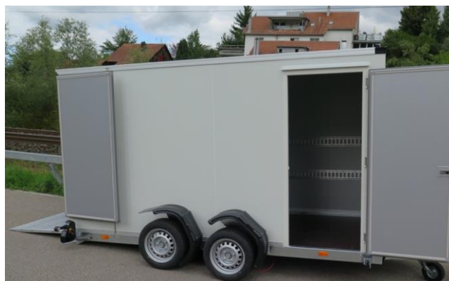
Seitentüre gegen Mehrpreis