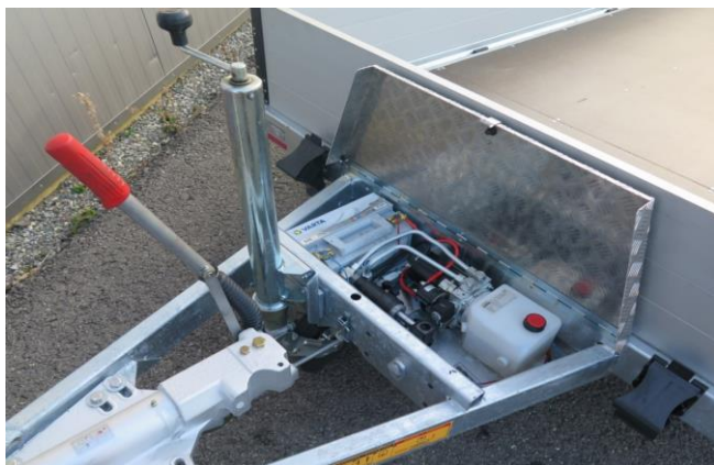
Elektropumpe mit Handpumpe kombiniert (Mehrpreis)