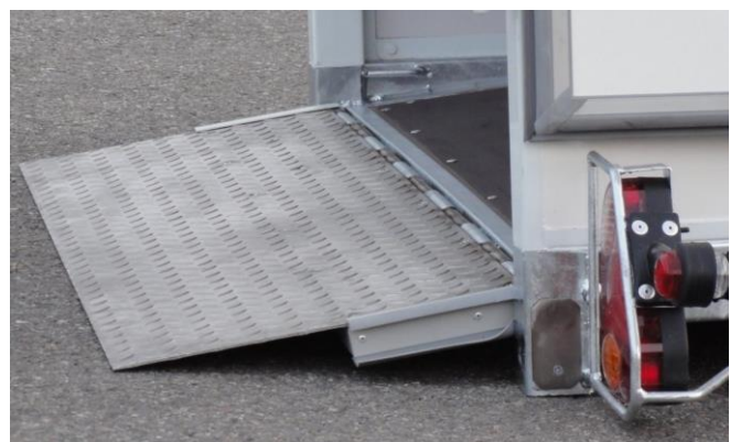
Standardrampe, ca. 500kg belastbar