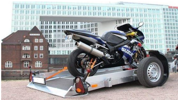
Anfahrkeil (ohne Rückwand)