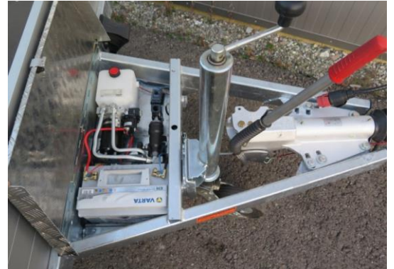
Elektropumpe Handpumpe kombiniert, mit Batterie