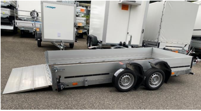
Boden hinten gerade, 60cm TT-Aluminiumrampe 1500kg belastbar