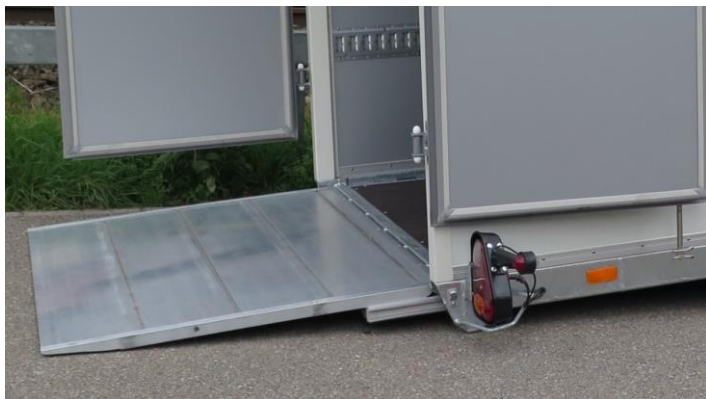
Rampe in Sonderausführung, Traglast 1200kg mit Anfahrschütz (Mehrpreis)