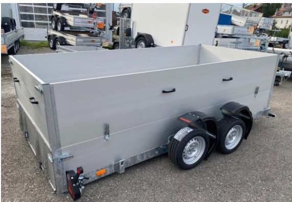
Aufsatzwände + 60cm, abnehmbar