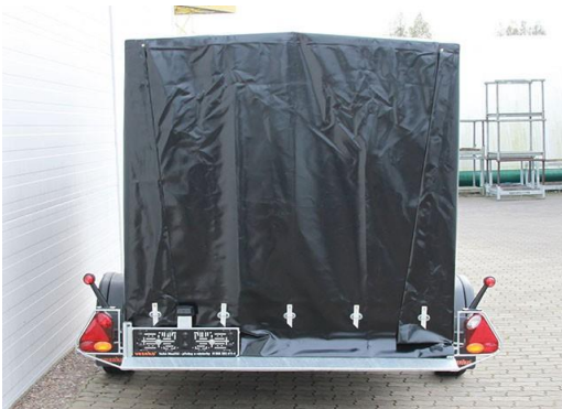
Blachenaufbau, hinten ohne Rückwand mit Anfahrkeil