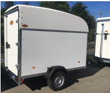
KT-P 2513/135 M

Wände nur mit Folien 3M 3690B oder Orajet 3951 HT beklebbar