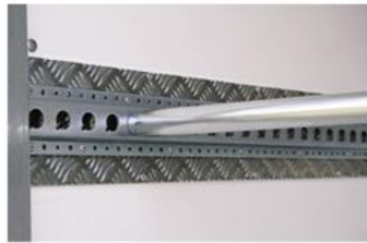
Absperrstange / Ankerschiene