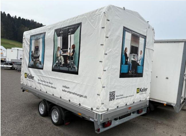
HL-AL mit Blachenaufbau mit Werbebeschriftung