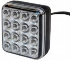
Nebellampe, rot LED