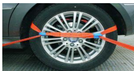
Zurrgut 3-teilig um Rad