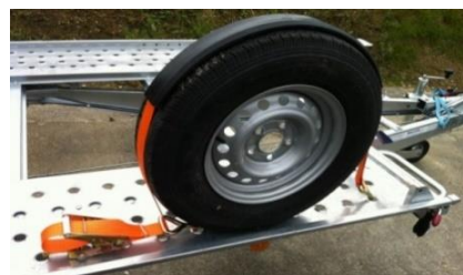
Zurrgurt mit Gummiband