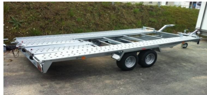
L-AT 400 T-KI GG 2600kg