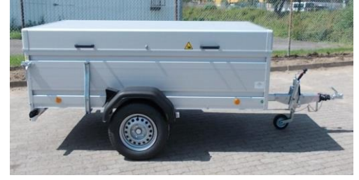
Tieflader mit Deckel, Modell DB