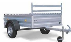
Seitenreling, H-Gestell vorne