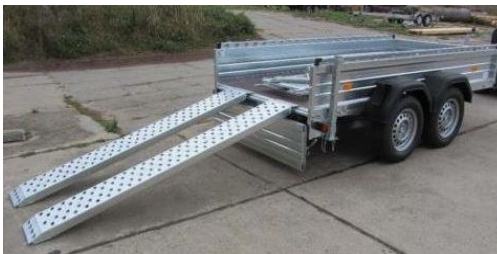
H-Gestell vorne, Lochreling seitlich gegen Mehrpreis