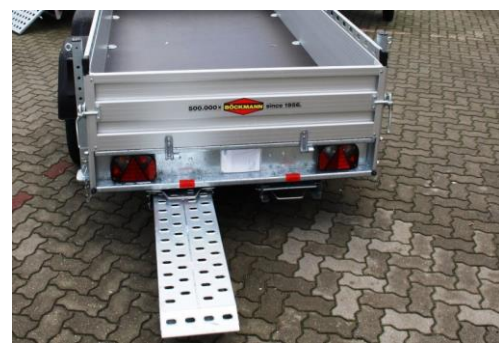
Rampen unten einschiebbar