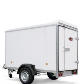
1 Flügeltüre Model 2513, andere Modelle mit Doppeltüren

Tandemachser: Anhänger mit 2000kg, 2700kg, 3000kg und 3500kg Gesamtgewicht