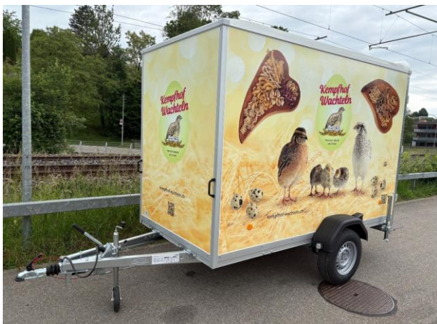
Beschriftung ganzflächig foliert