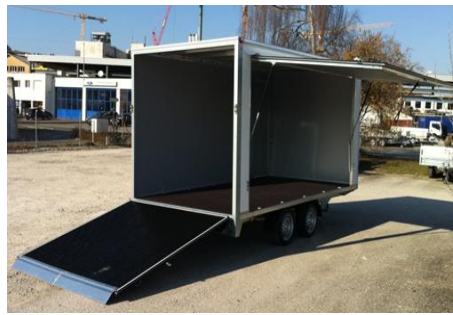
Heckrampe mit Seitenklappe