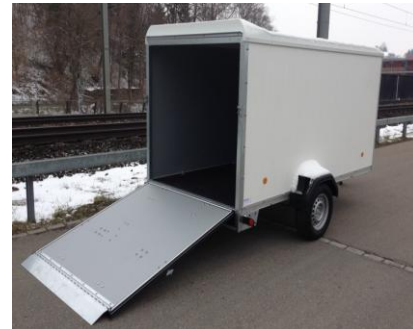
Rampe ohne Belag