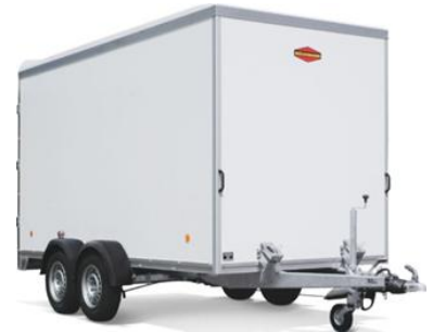
KT 3018 / KT 4018