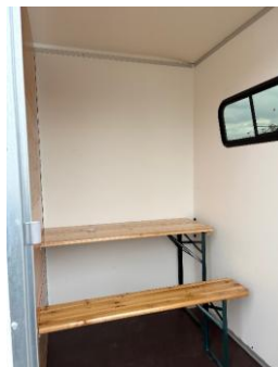
Sitzbank in Pausenraum / Fenster