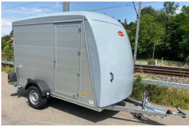
KT-PB-AL 3015/15 H