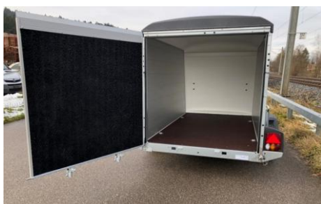
Kombirampe mit Anfahrkeil und Silikon-Antirutschbeschichtung