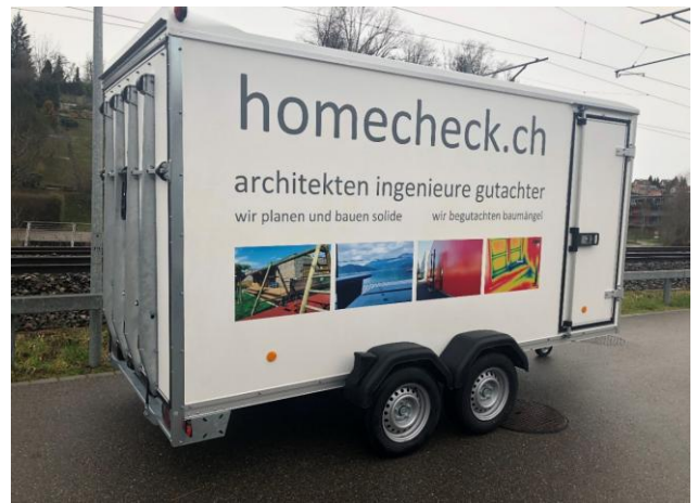
Beschriftung mit einzelnen Schriftzügen