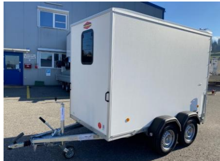
Fenster in verschiedenen Grössen