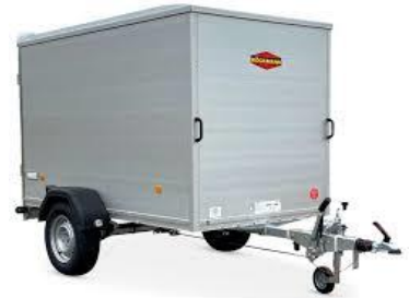
Serie KT-AL Aluminiumwnde, Polyesterdach Flügeltüren