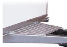
Alublech-Auftritt auf Deichsel