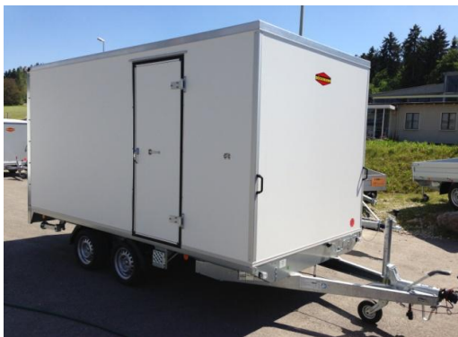
Seitentüre mit Klaptritt

Wände nur mit Folien 3M 3690B oder Orajet 3951HT beklebbar