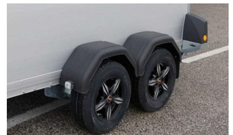
Schwarze Alufelgen (Mehrpreis)