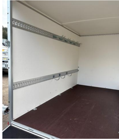
Werkzeuganhänger mit Rampe, Seitenklappe, Schienen und Werkzeughalter, Karettenhalter, Lagergestell Würth, Tablare Weitere Möglichkeiten mit Trennwand und Seitentüre für Büro/Pausenraum mit Fenster und Tisch/Bank