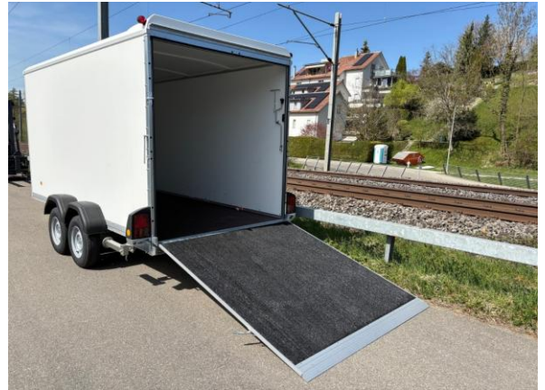
KT 4018/35 H mit Kombirampe, auch als Türe zu öffnen