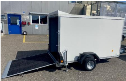
Serie KT 2513 F mit Niederfahrwerk Sonderbereifung, Tiefgaragentauglich Ladehöhe 35cm, flacher Rampenwinkel