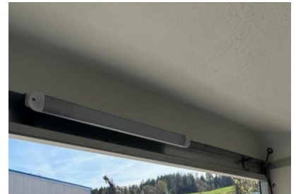
LED Lampe über Türrahmen