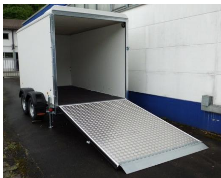
Rampe mit Aluriffelblech