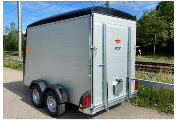
KT-PB-AL 3015/27 H