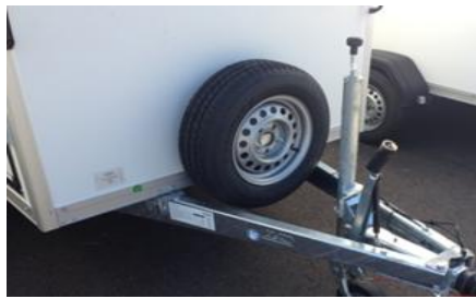
Ersatzrand mit Halter