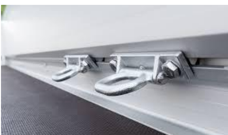
Verstellbare Zurrbügel 600kg