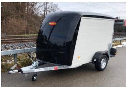
Serie KT-PB-AL Aluminiumwnde, Polyesterdach und Polybug in div. Farben, Kombirampe Rampe auch als Türe