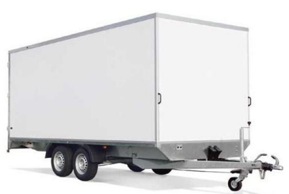
Serie KH Hochlader Plywood-Holzwnde Alu- oder Sandwichdach

1-Achser: Anhänger mit 750kg, 1350kg und 1500kg Gesamtgewicht