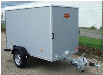
Standardmodelle KT 2513