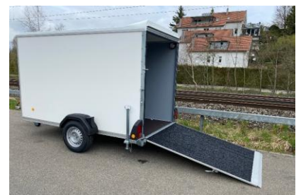
Kombirampe mit Anfahrkeil am Rampenende