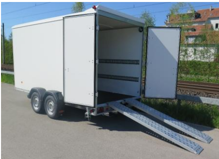
Stahlrampen unten einschiebbar