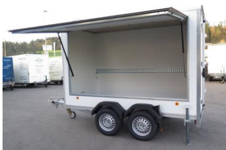
Seitenklappe KT 3015