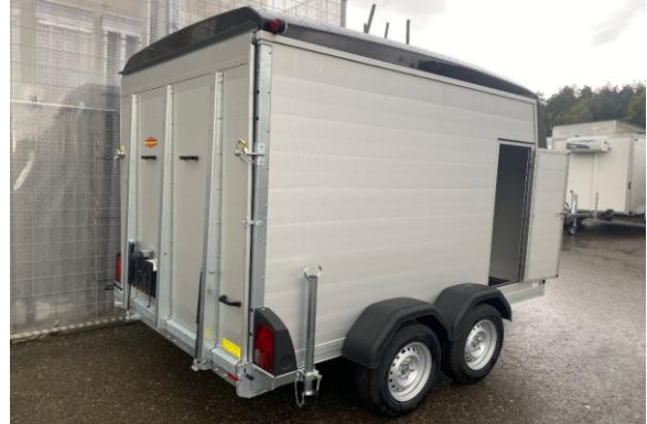
Seitentüre KT-PB-AL 3018/27 H

Farbauswahl anstatt Standardfarbe anthrazit (schwarz):