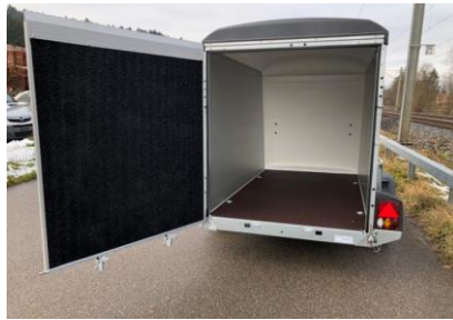
Serie KT Kombirampe Plywood-Holzwnde, Polyesterdach Kombirampe, Rampe auch als Türe