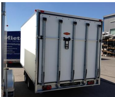
Heckrampe bei Hochlader