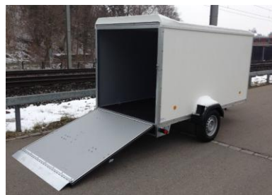
Standardrampe, Überwurfblech am Rampenende