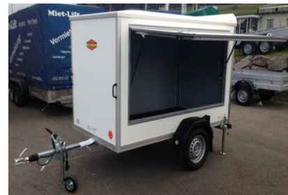
Seitenklappe KT 2513