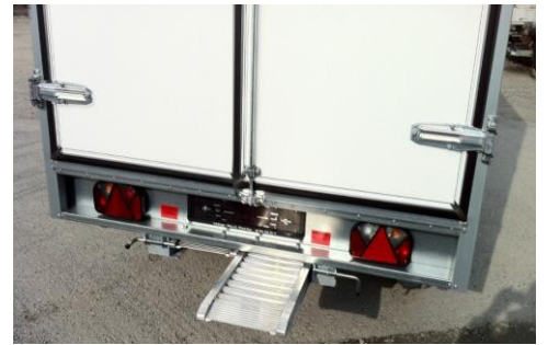
Alurampen unten einschiebbar