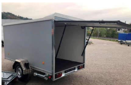
Heckklappe nach oben aufgehend