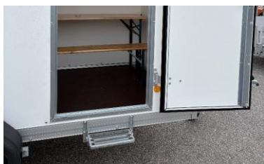
Klaptritt unter Seitentüre