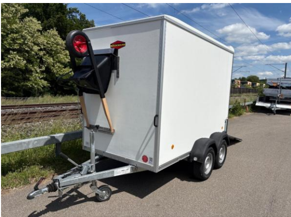
Karettenhalter an Frontwand