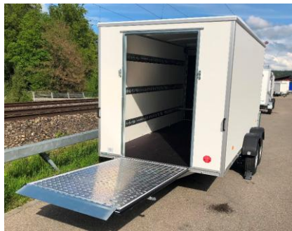
vorne Rampe für Durchladen