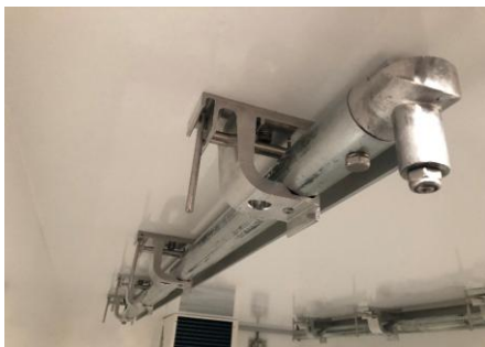
Rohrbahnanschluss EU, Befestigungswinkel links