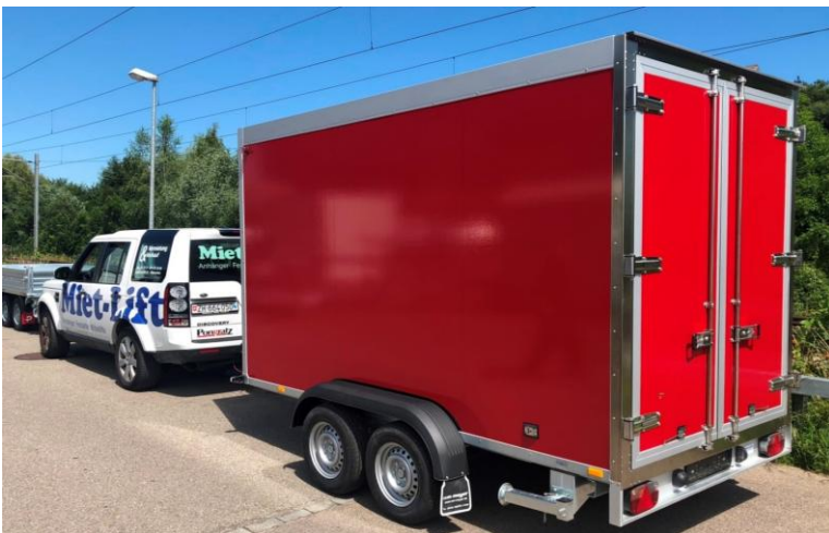
AZK Tiefkühler rot foliert