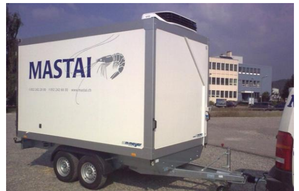
Werbedruck nach Kundenangaben