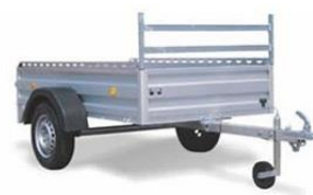
Seitenreiling, H-Gestell vorne