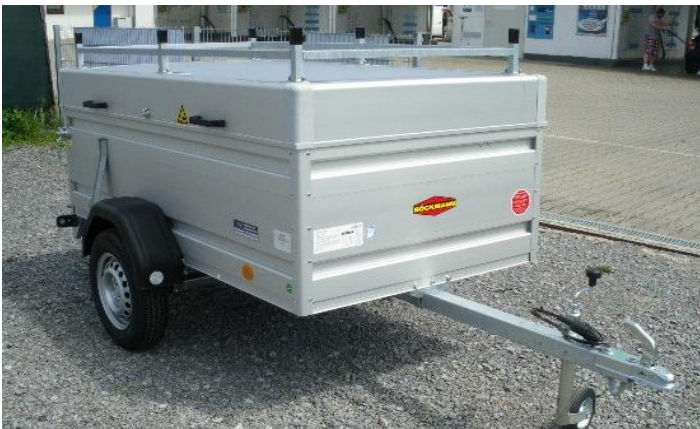
Reling auf Deckel