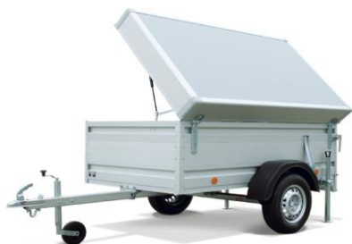
Tiefloader mit Deckel, Modell DB