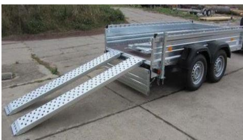
H-Gestell vorne, Lochreling seitlich gegen Mehrpreis