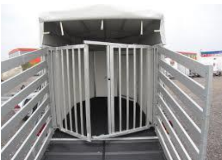
Treib- / Trenngitter