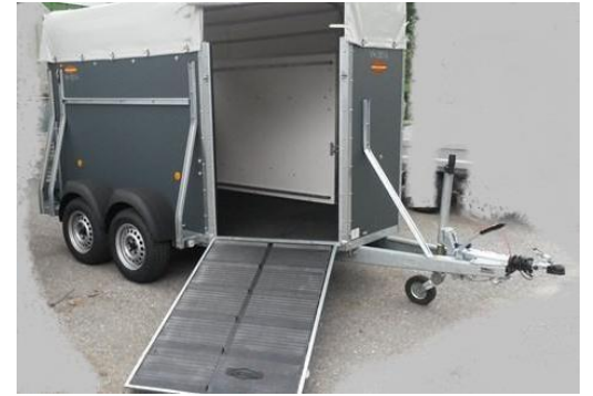
Vorderausstieg mit Gummibelag Öffnung über Rampe geschlossen