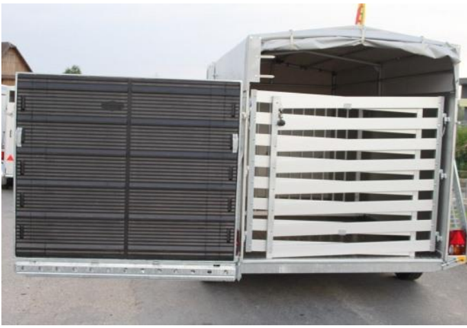
Kombirampe als Türe zu öffnen