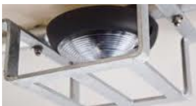
Schutzgitter über Lampe