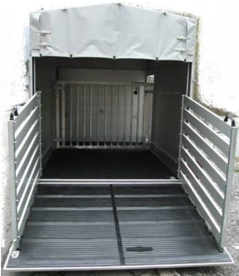
Trenngitter, Treibgitter 140cm