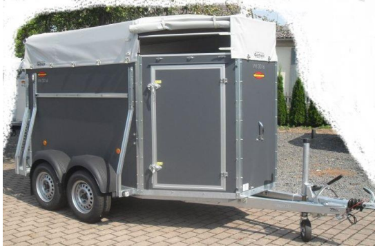
VH 3014 Holzwände