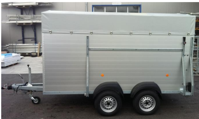
VA 3520 Aluminiumwände, Aluminiumboden