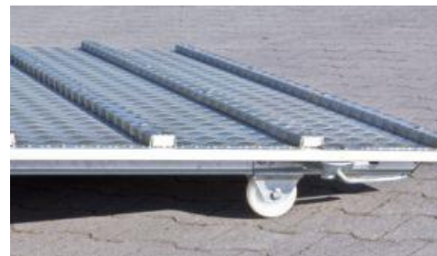
Rollen an Heckrampe