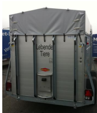
Öffnung über Rampe geschlossen