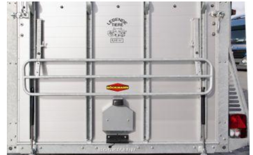
Gitter über Hinterklappe