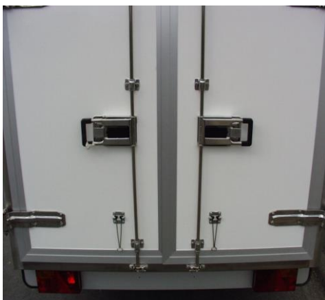
2 Hecktüren mit je 1 Stangenverschluss