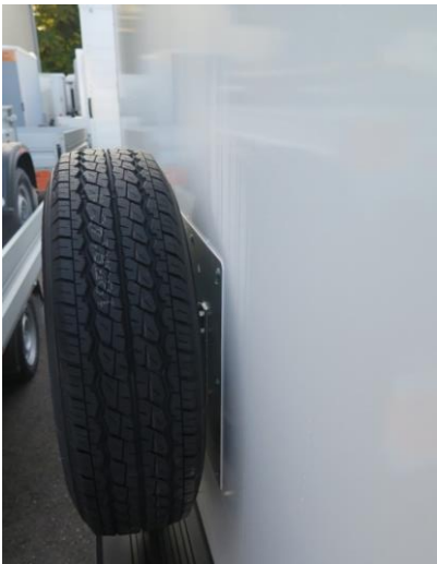
Ersatzrad mit Aluplatte auf Seitenwand