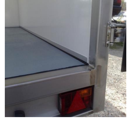
Tiefkühlanhänger mit Seitentüre, 100mm Isowände