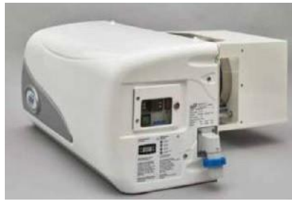
Kühlgerät GOVI elektronisch regelbar