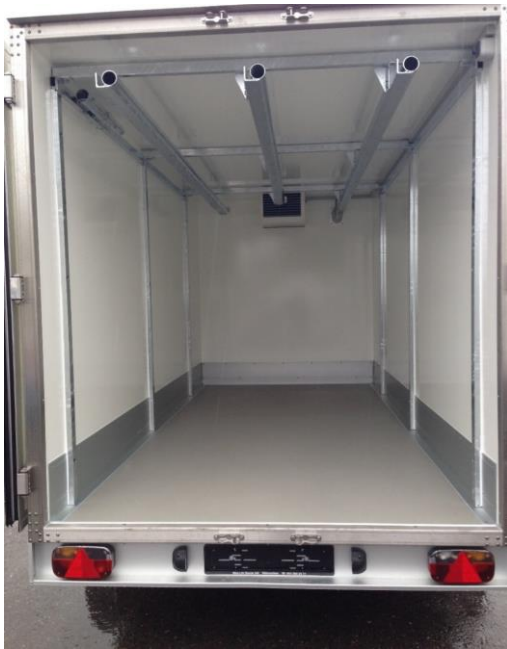
AZK Sonderanfertigung Rohrbahnen