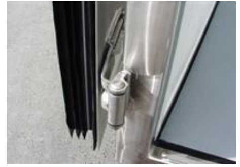
AZK 2730/156 mit Fleischrohrbahnen