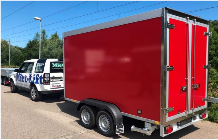
AZK Tiefkühler rot foliert