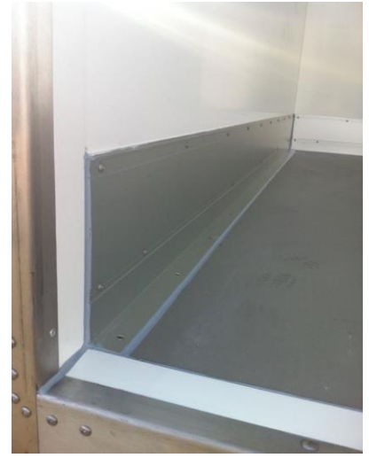
Alu-Rammschutz auf 3 Seiten, ca. 25cm hoch