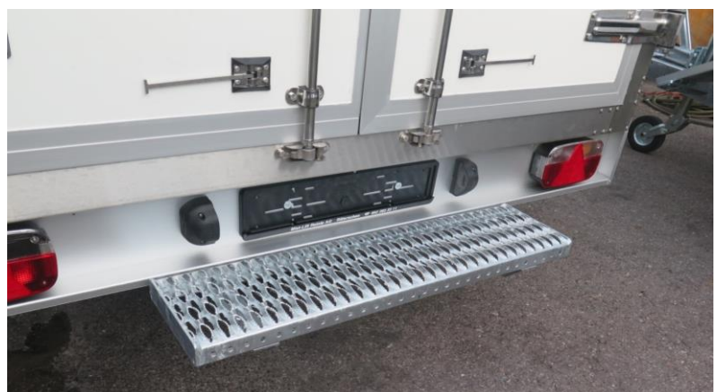
Ausziehtritt unter Lichtbalken