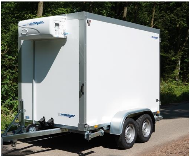
AZK mit Kurbelausdrehstützen statt Spindelstützen