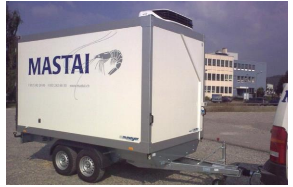
Werbedruck nach Kundenangaben