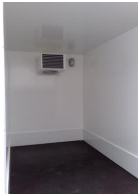
Rammschutz auf 3 Seiten