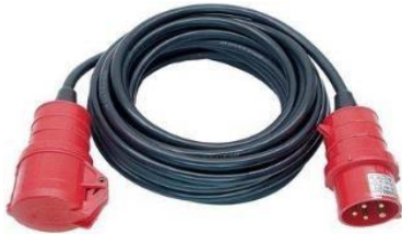
Verlängerungskabel 20m 380/400 Volt, 16A CEE