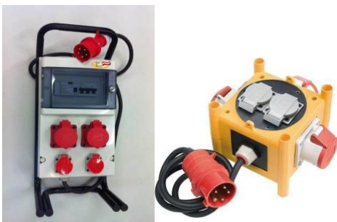
Kleinstromverteiler 380/400-220 Volt 16A mit FI-Schalter