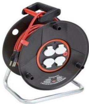
Kabelrolle 30m 220 Volt