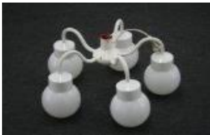
Hängeleuchte mit 5 weissen Kugeln à 60 Watt, 220 Volt Miet-Lift Art. Nr. 13108