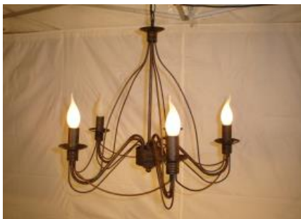
Hänge-Kerzenleuchter mit 5 Kerzenbirnen, 220 Volt Miet-Lift Art. Nr. 13109