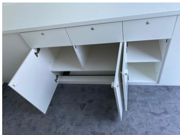
Aussenschrack 93cm, Schrack 2-türig 90cm, Schrack 1-türig 34cm, mit Schubladen