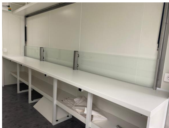
Glasscheiben auf Verkaufstheke