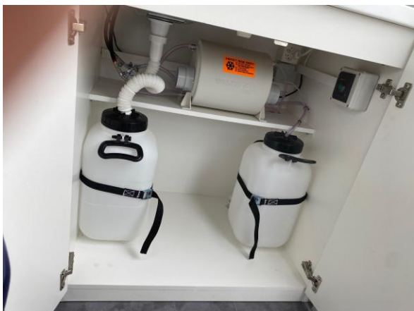
Waschbecken mit Schrank, Warmwasserboiler, 2 Wassertanks. Grösse 58 x 93cm, Höhe 93cm