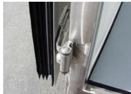
AZK 2730/156 mit Fleischrohrbahnen