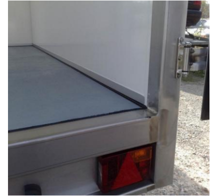
Tiefkühlanhänger mit Seitentüre, 100mm Isowände