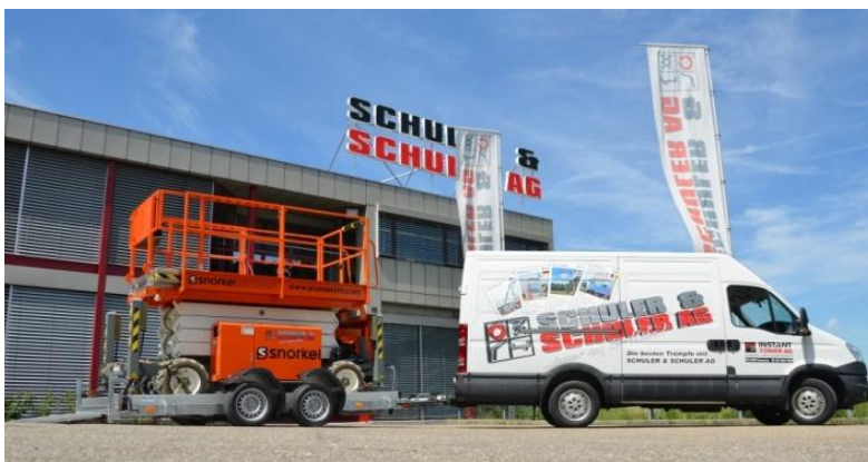
Scherenbühne mit Eigengewicht von 2700kg auf Absenker FB 35.35, 345 x 162 x 10cm GG 3500kg mit Alurampe