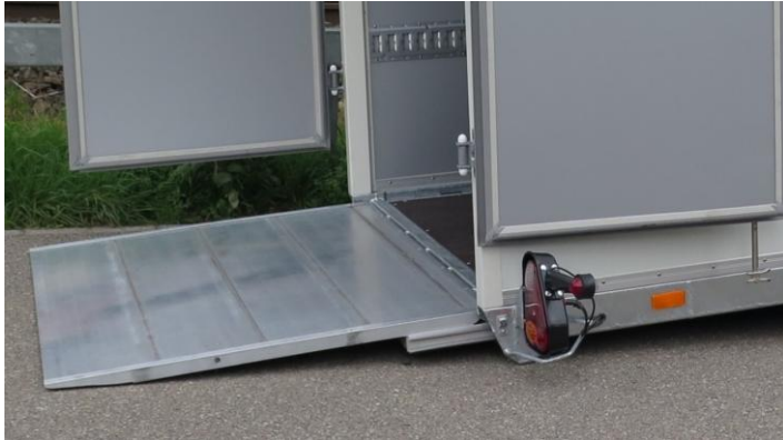
Rampe in Sonderausführung, Traglast 1200kg mit Anfahrspitz (Mehrpreis)