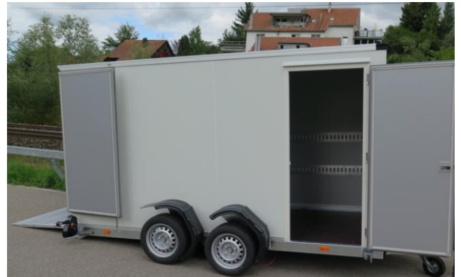
Seitentüre gegen Mehrpreis