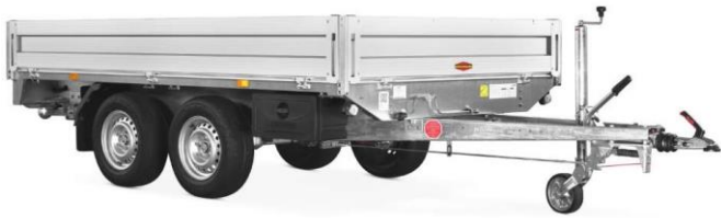
Bis Länge 414cm ohne Mittelposten