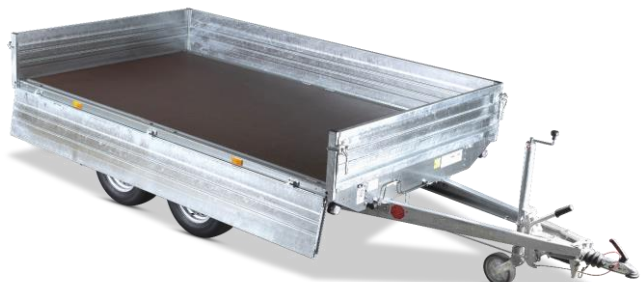
HL-ST mit feuerverzinkten Stahlwänden