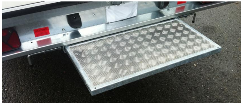
Ausziehtritt unter Lichtbalken, 80x40cm