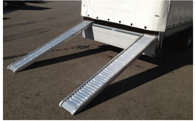
Aluminium-Auffahrrampe (unter Brücke gelagert)