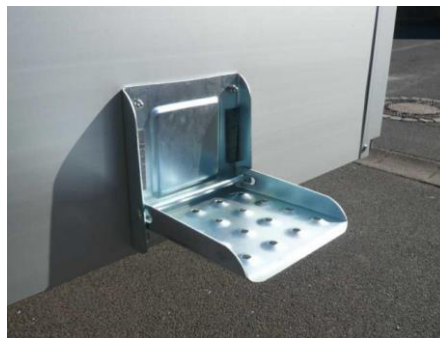
Klaptritt an Heckwand montiert