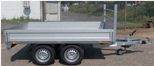
HL-AL 3016 mit H-Gestell vorne