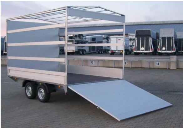
HL-AL mit Blachenaufbau und Heckrampe 180cm hoch