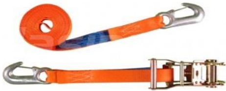
Zurrgurte in verschiedenen Längen