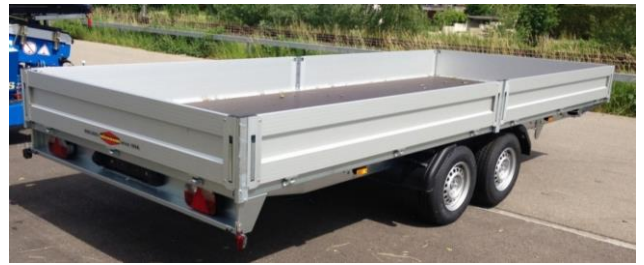
ab 514cm Länge mit geteilten Wänden, Mittelposten