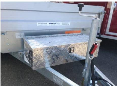
Alubox auf Deichsel montiert