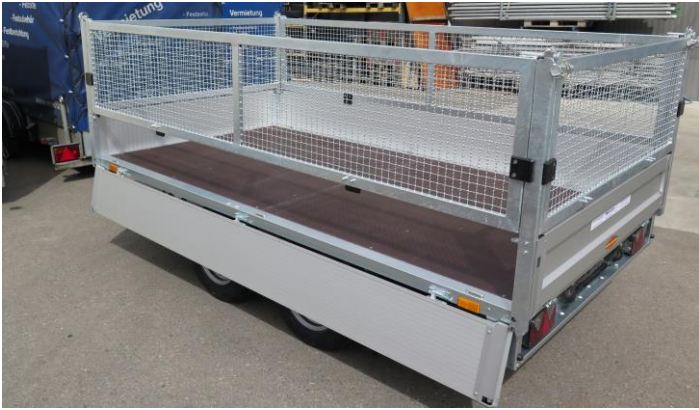
HL-AL 3218/35 SF, Laubgitter + 62cm