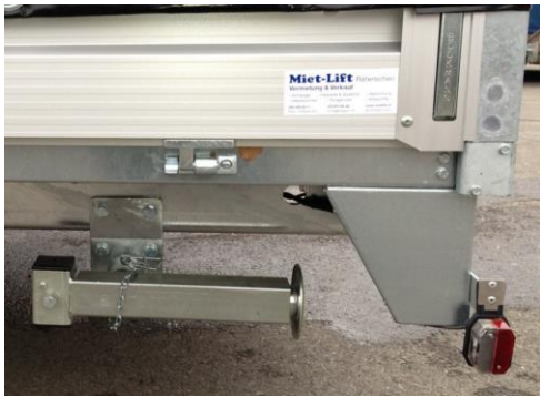
Kurbelstütze, Traglast 1200kg, abschwenkbar