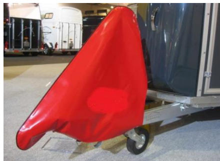
Schutzhaube über Stützrad und Kupplung