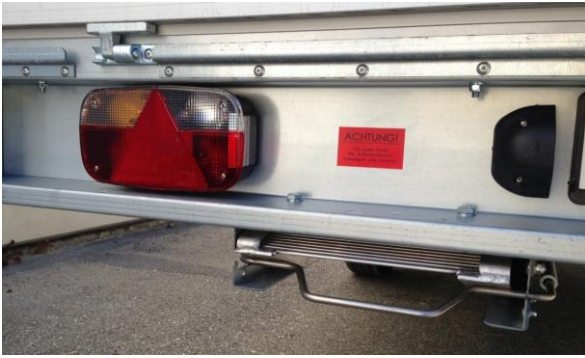
Rampen unter Brücke mit Sicherungsbügel