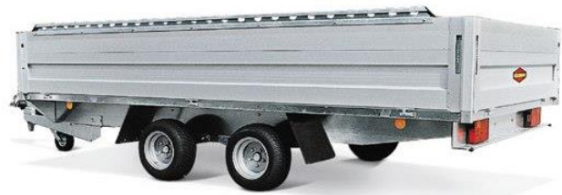
HL-AL mit 50cm Bordwände und Loch-Bindereling