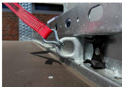
Zurringe daN 2000