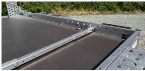
Anfahranschlag / Positionierhilfe