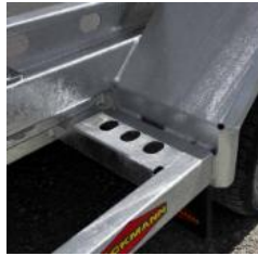
Auftritt bei Kotflügel