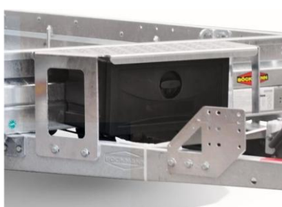
hohe Schaufelablage Podest