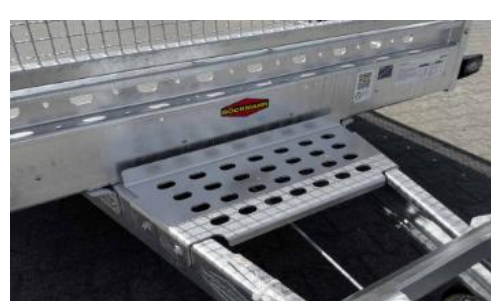
flache Schaufelablage, Standard