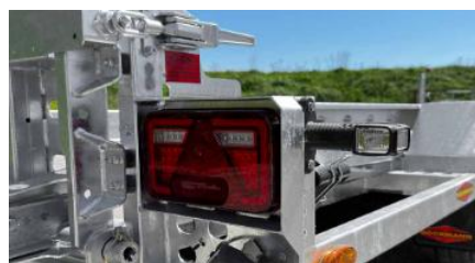
LED Beleuchtung (Rückleuchten)