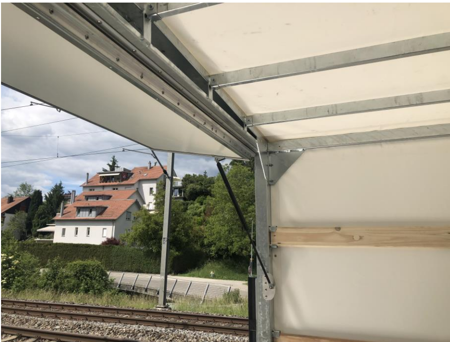
Klappe über Hebebühne