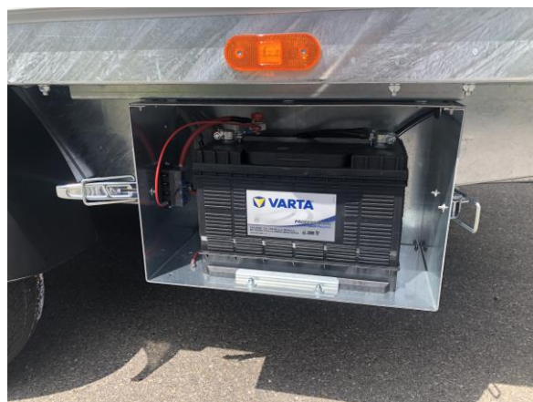
Batterie in Alukasten