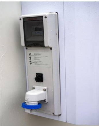
Kühlaggregat / Bedienung