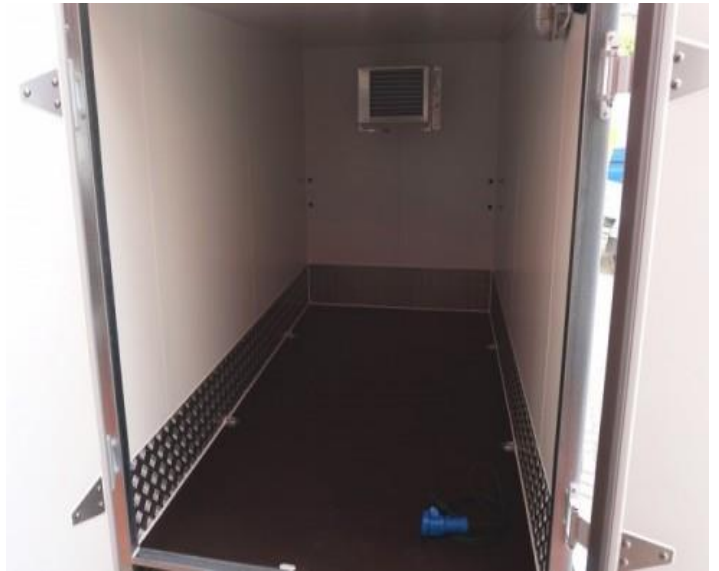
Standart: Holzboden mit Alu-Scheuerleisten