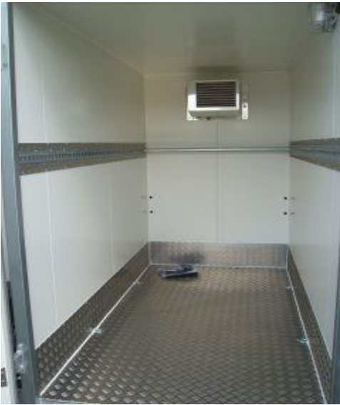
Isoboden mit Aluriffelblech