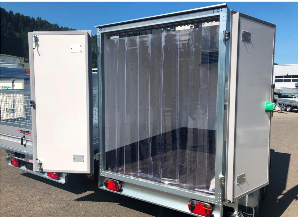
Lamellenvorhänge gegen Kälteverlust