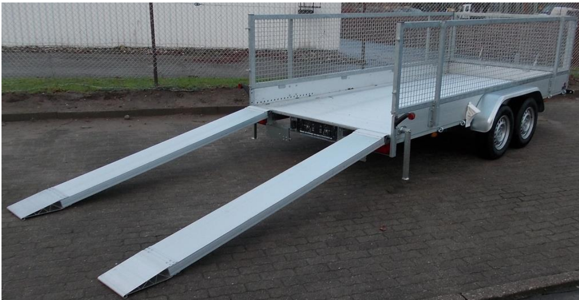
AMT 2500, 440 x 190cm, Laubgitter + 70cm, Aluminium-Auffahrrampen