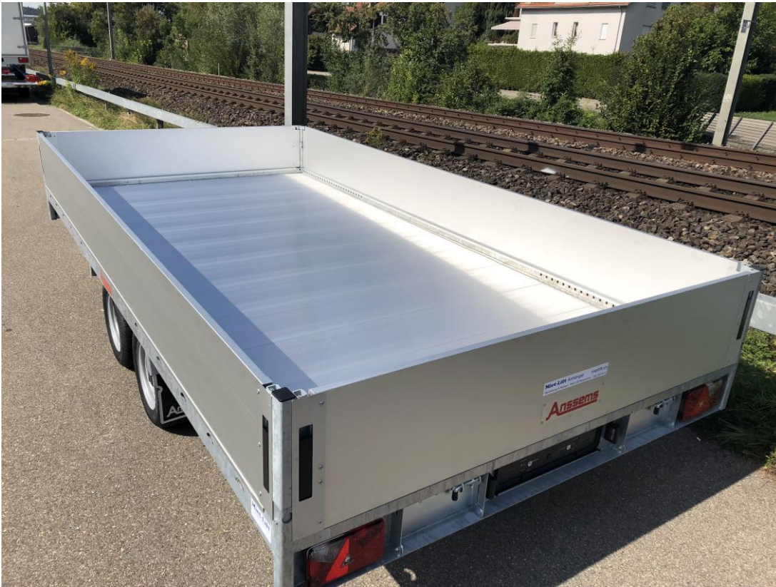
Aluminiumprofilboden, Aufsatzwände + 36cm