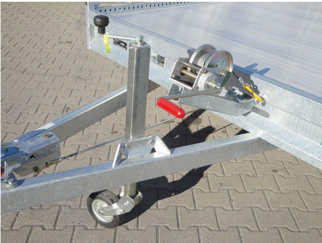
Handseilwinde vorne einsteckbar, links oder rechts