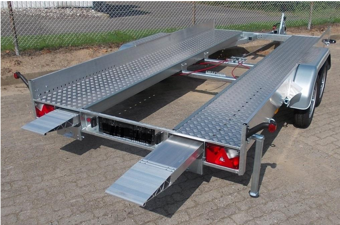
AMT 2000 ECO, 400 x 180cm