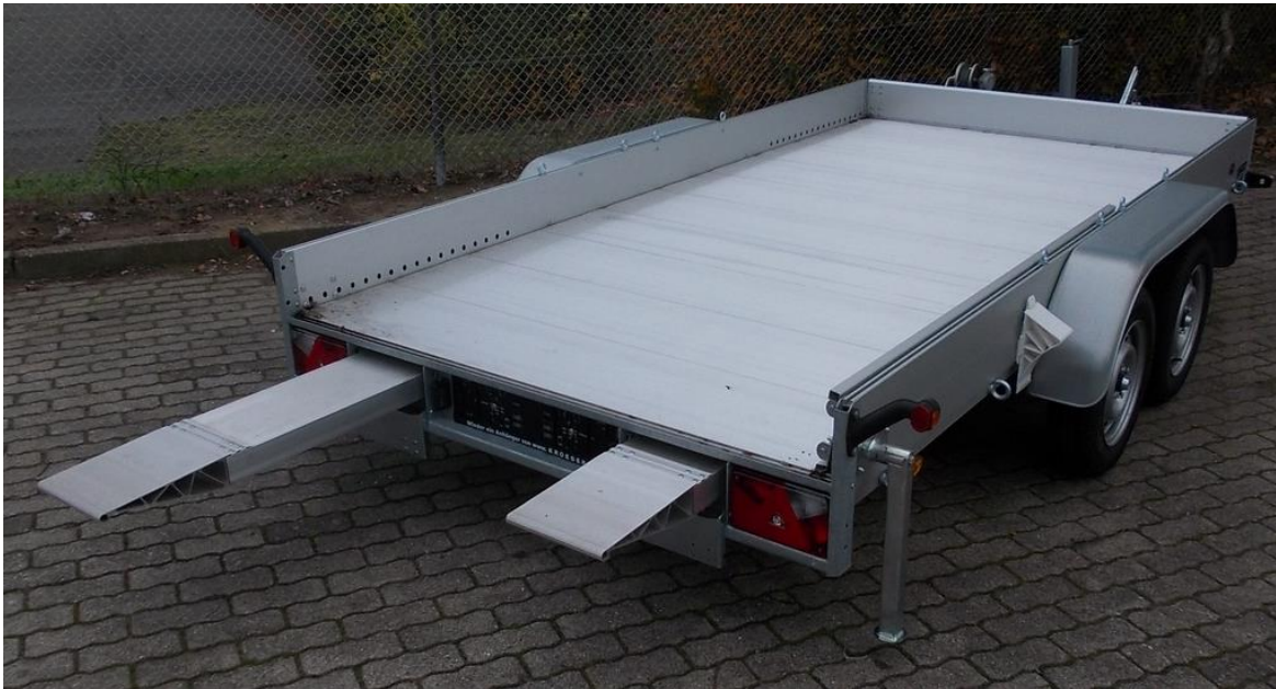
AMT 2500, 340 x 180cm