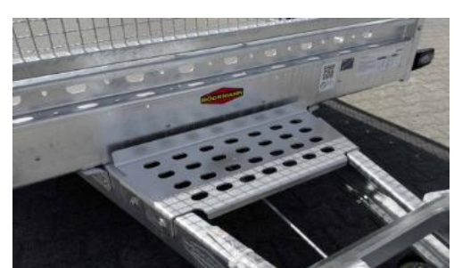
flache Schaufelablage, Standard