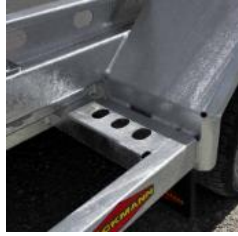
Auftritt bei Kotflügel