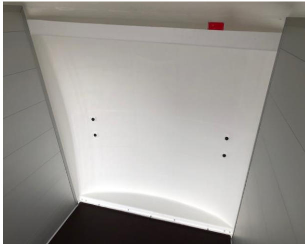
Ablagefläche vorne, oben im