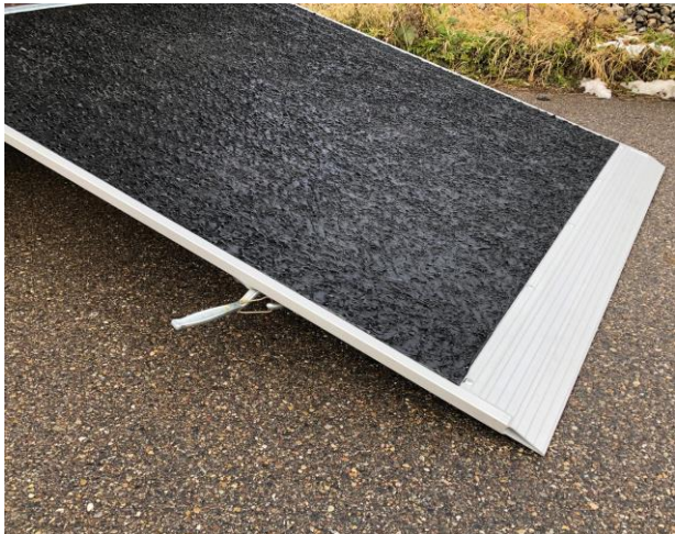
Rampenende mit Spitz Polysterbug

Anhänger Zügel-Lifte Hebebühnen Zelte Gas Vermietung-Verkauf-Reparaturen