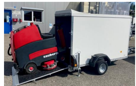
KT 2513/135 mit Kombirampe Plywoodwände, Niederfahrwerk 10" statt 13" Räder ca. 35cm Ladehöhe, flacher Rampenwinkel