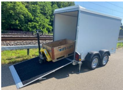
KT Kombirampe Plywoodwände, Polyesterdach Kombirampe, Rampe auch als Türe zu öffnen Rampe mit Antirutschbeschichtung