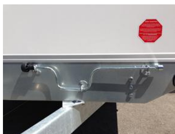
Handkurbel für Kurbelstützen