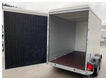
KT-AL Kombirampe Aluminiumwände, Polyesterdach Kombirampe, Rampe auch als Türe zu öffnen Rampe mit Antirutschbeschichtung