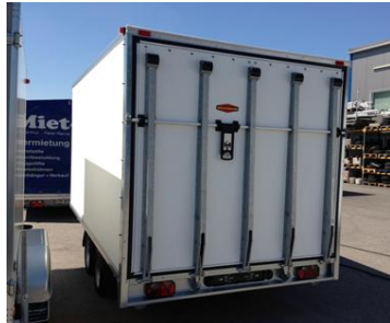
Hochlader mit Heckrampe, Hebehilfen