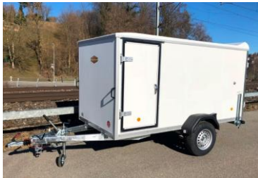
Seitentüre KT 2513 + KT 3015