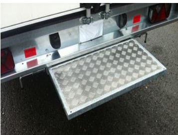
Auszugtritt Klapptritt gross, seitlich