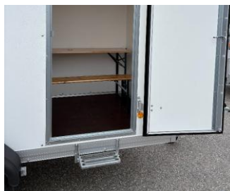
Klapptritt an Seitenwand