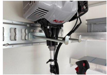
Doppelhaken für Schaufeln etc.