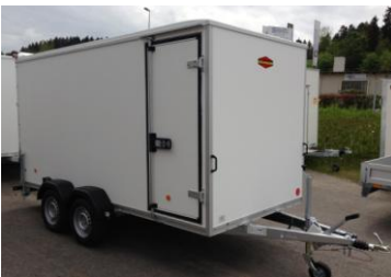
Seitentüre KT 4018