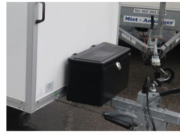
Werkzeugkisten diverse Grössen / Kunststoff und Aluminium