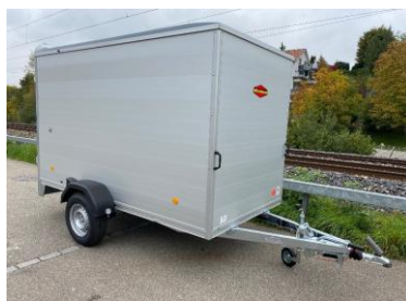
KT-AL 1-Achser und Tandemachser Aluminiumwände, Polyesterdach 2 Flügeltüren