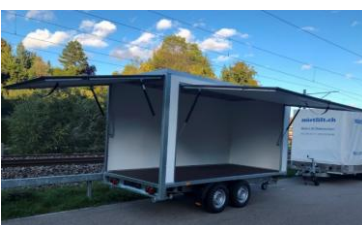
Niederfahrwerk, 2 Ausstellklappen