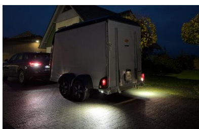
Umfeldbeleuchtung mit zusätzlichen LED Scheinwerfer