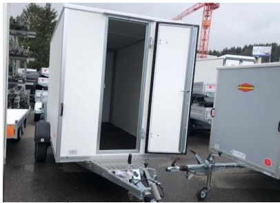
Türe in Frontwand