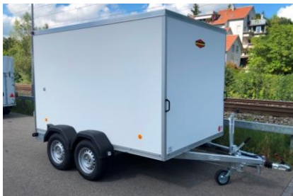
KT 1-Achser und Tandemachser Plywoodwände Polyesterdach 2 Flügeltüren