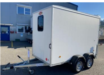
Schiebefenster mit Gitterstäbe