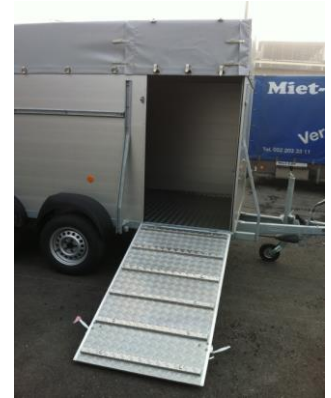
VA 3520 Aluminiumwände, Aluminiumboden