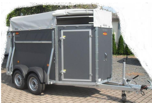
VH 3014 Holzwände

WCF-Modelle: WCF-Fahrgestell mit Radstossdämpfer = nur für Modell mit 2,4t.