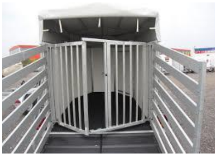
Treib- und Trenngitter