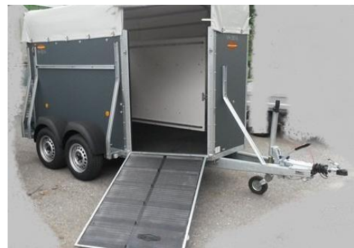
Vorderausstieg mit Gummibelag