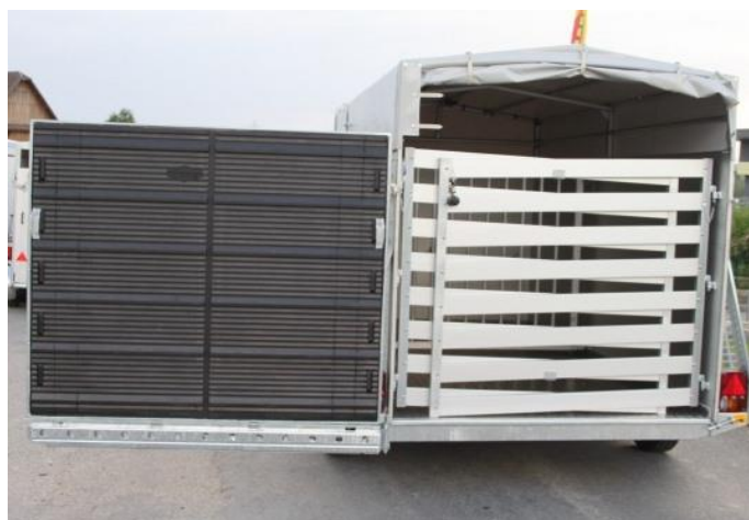
Kombirampe als Türe zu öffnen