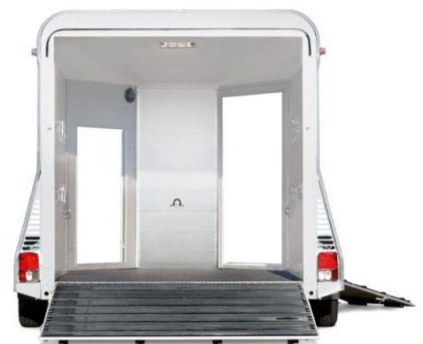
VA 3520 Aluminiumwände, Aluminiumboden, Polyesterhaube