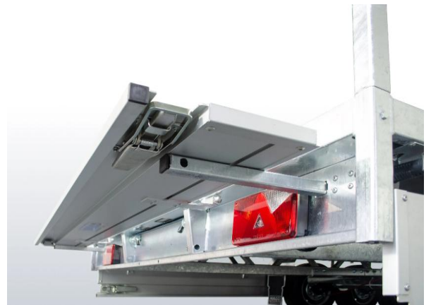
Auszugrohre für das Ablegen der Rückwand